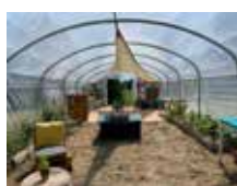
Sobriété du lieu

Vers l'autonomie alimentaire grâce à une approche permaculture 100% naturelle et végétarienne